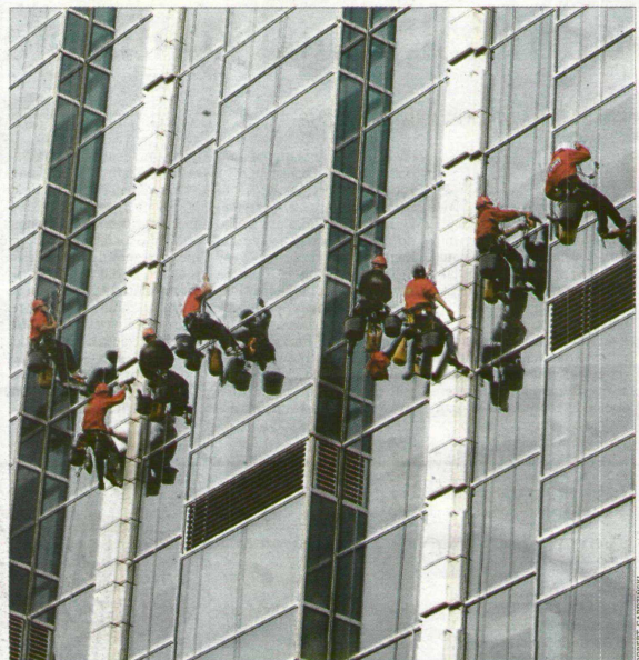
* Polacy najczęściej zmieniają pracę, dlatego że chcą lepiej zarabiać. Większe pieniądze można otrzymać, wykonując np. nietypowe zajęcia

masz pytanie, wyślij e-mail do autorów a.niewinska@rp.pl i.stryzyk@rp.pl